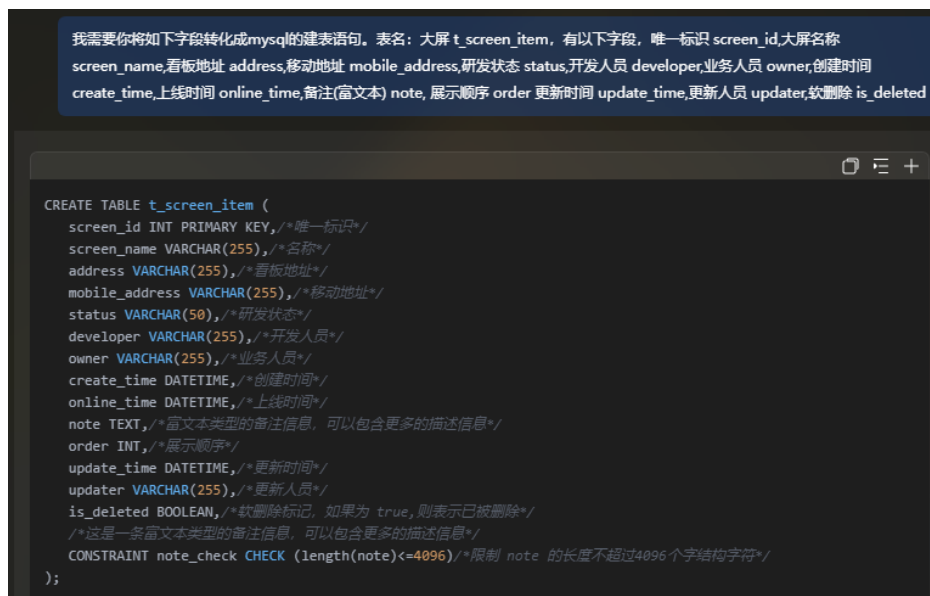
图 2-3 研发问答示例